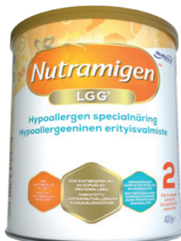
Nutramigen 2 LGG® Från 6 månader och framåt

Vill du ha flera råd eller har du frågor om våra produkter? Kontakta gärna vår kundtjänst på telefon: 08-586 33 500 mellan kl 9–15 vardagar eller email: nutrition@scandinavianbiopharma.se