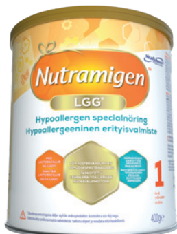
Nutramigen 1 LGG® Från födseln till 6 månader