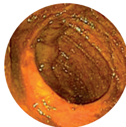
Chuẩn Bị Kém

Norgine Sverige AB Gustav III:s Boulevard 34 169 73 Solna norgine.se